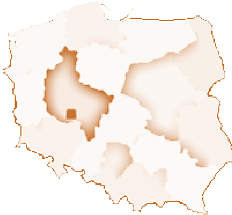
Rysunek 1 – Gmina Pępowo na mapie Polski