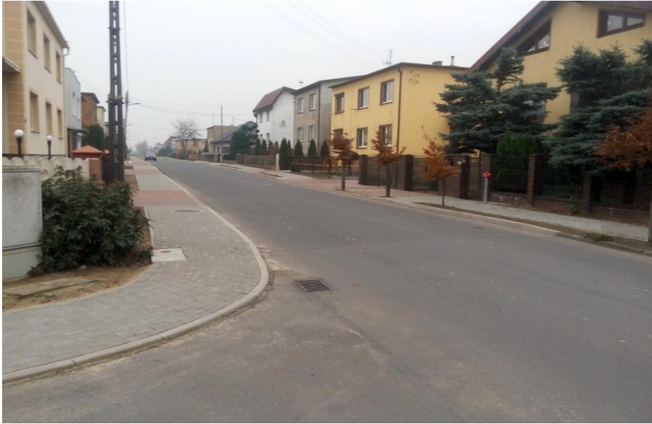
10. Budowa drogi w Krzekotowicach (PKP) - 39.599,60 zł,