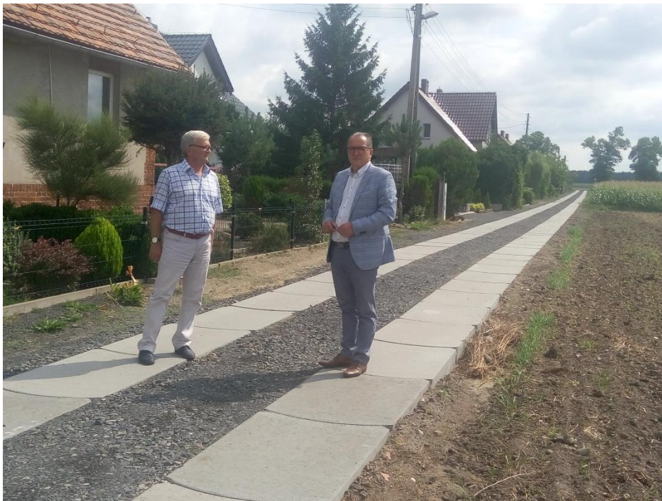
11. Przebudowa drogi gminnej wraz z zabudową rowu w Gębicach - 42.761,83 zł