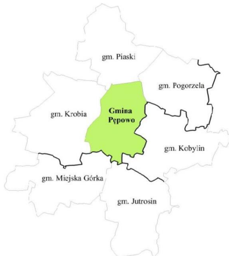
Rysunek 2 – Gmina Pępowo i gminy sąsiadujące