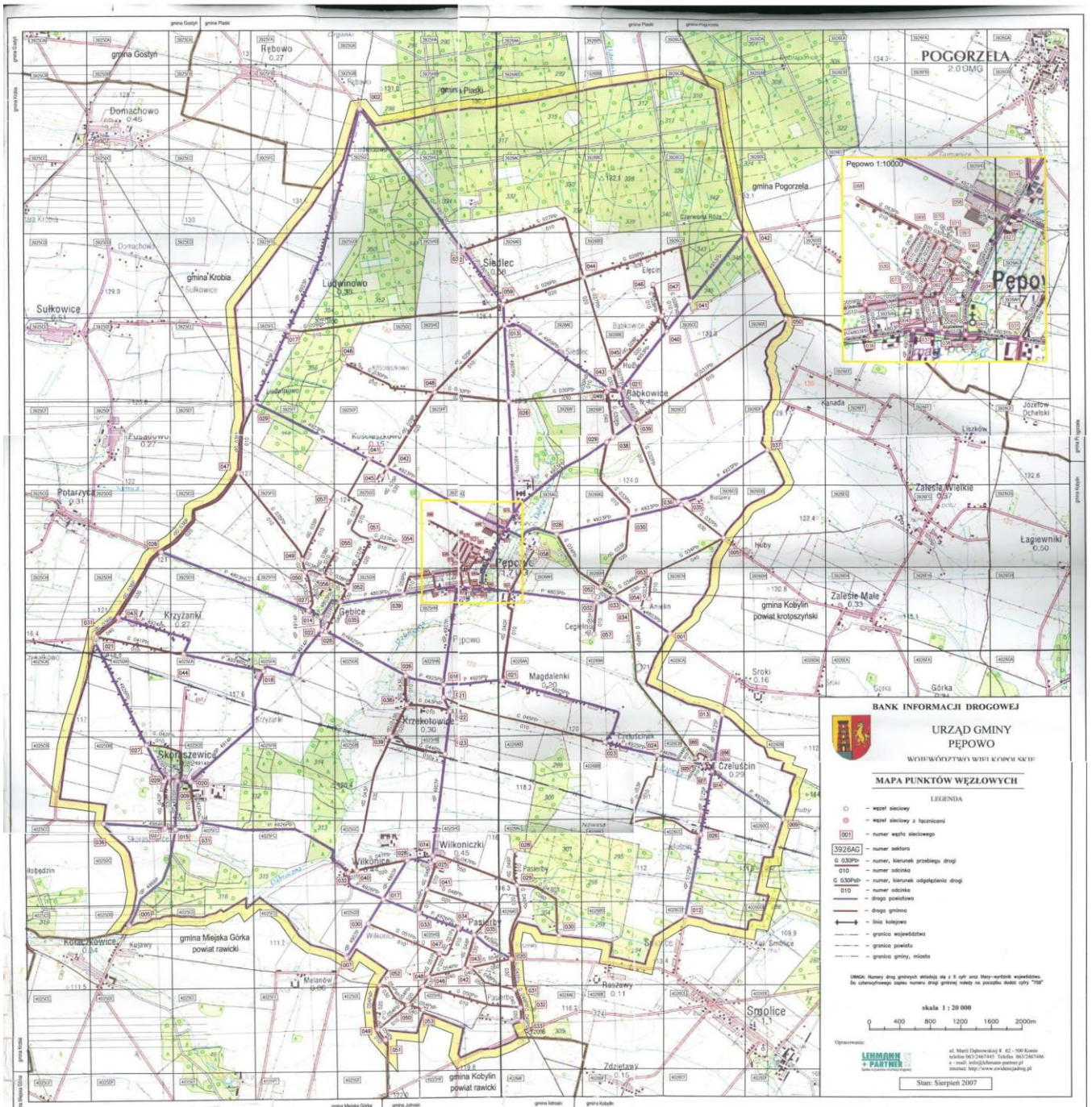
Rysunek 3. Przebieg dróg gminnych i powiatowych na terenie Gminy Pępowo