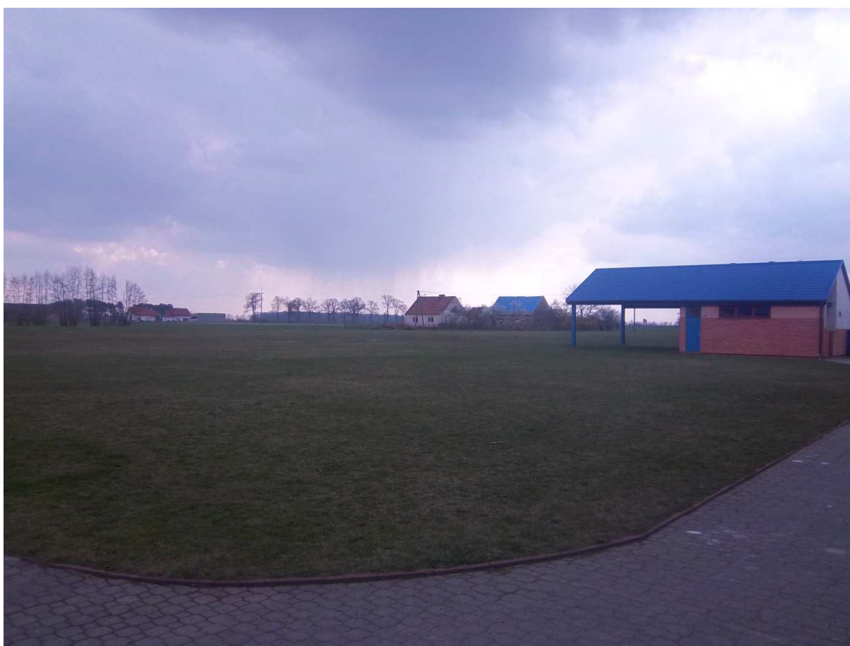
Miejsce na nowoprojektowane wielofunkcyjne boisko w Skoraszewicach