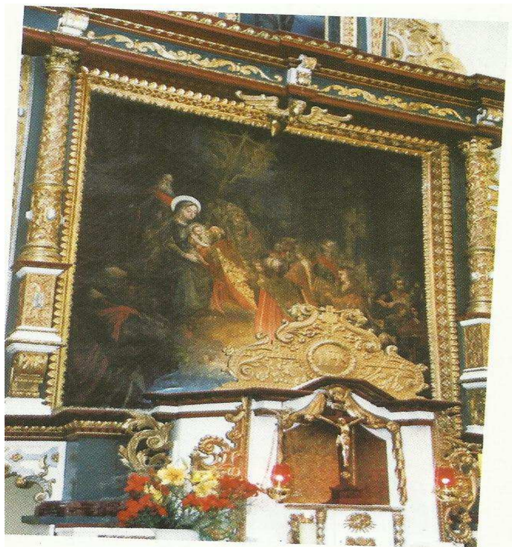
Cudowny Obraz Pokłon Trzech Króli