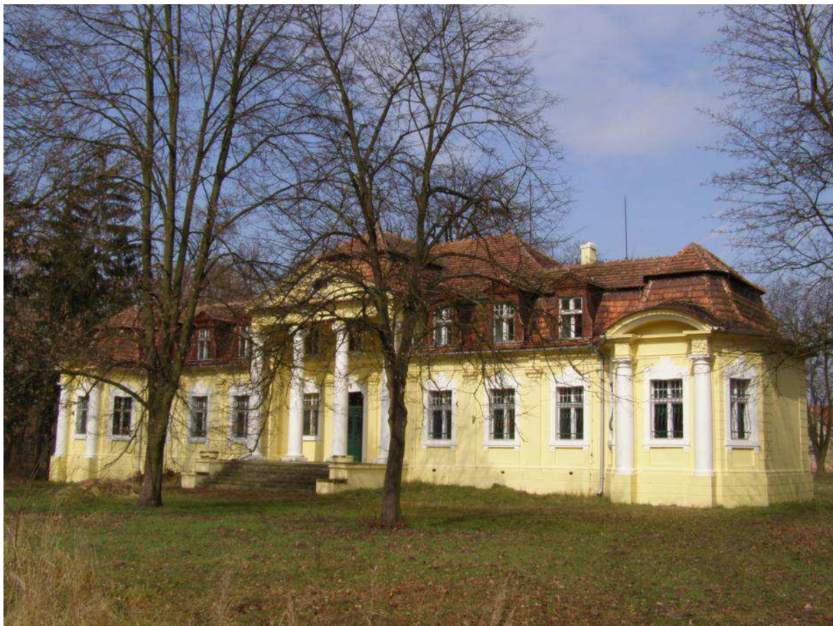
Dwór w Skoraszewicach

Walorem Gminy Pępowo jest jej typowy wielkopolski krajobraz rolniczy, który wraz z okolicznymi pałacami w Pępowie, Gębicach i Skoraszewicach stanowi dużą wartość architektoniczną.