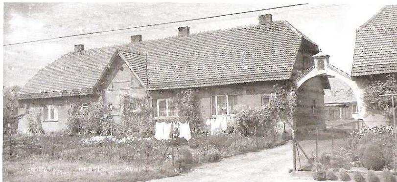
Kolonia domów pracowników folwarcznych