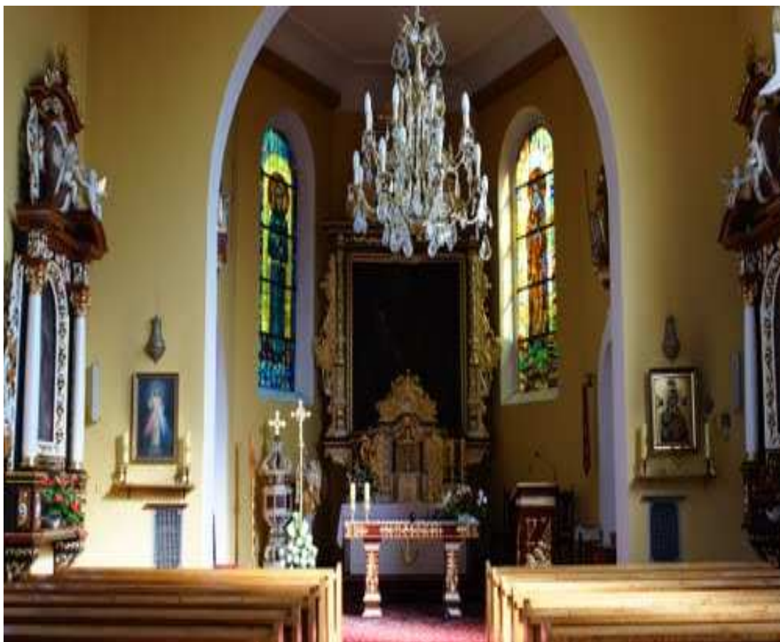
Prezbiterium w kościele pw św. Katarzyny

Czwojdziańskiego wynika. Ciekawym może być jeden szczegół o tym, że zapewne kiedyś istniały jakieś specjalnie drukowane modlitwy do Trzech Króli albo być może reprodukcje obrazu skoraszewickiego. Ówczesne Kartki Trzech Króli noszono zapewne przy sobie i w czasie choroby kładziono je na chorego, ufając, że to go uzdrowi.