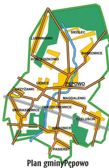
Plan gminy Pępowo

https://www.google.pl/maps/place/Polska/@51.7084412,17.1179361