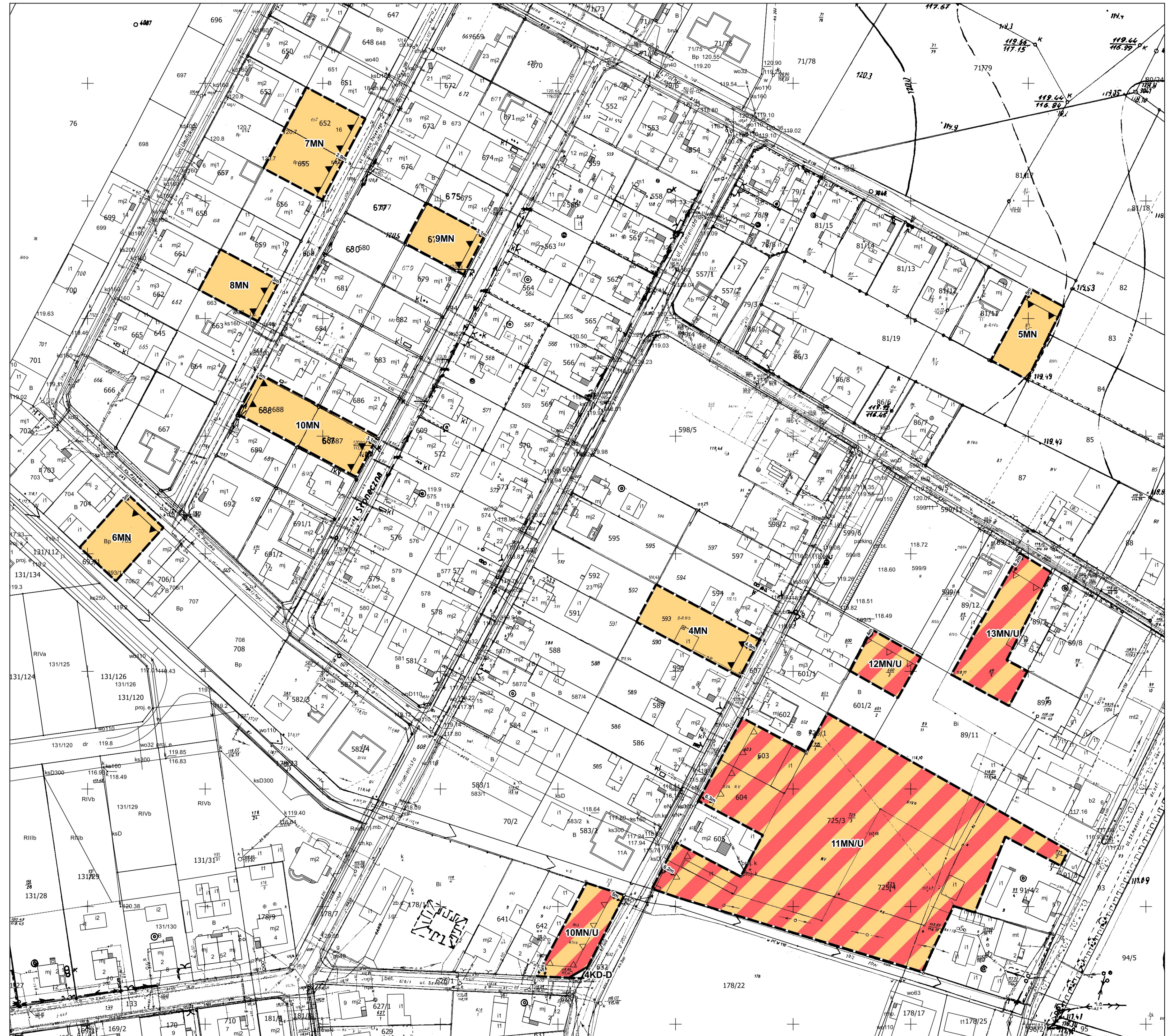
STUDIUM UWARUNKOWAŃ I KIERUNKÓW ZAGOSPODAROWANIA PRZESTRZENNEGO GMINY PĘPOWO SKALA 1:10 000