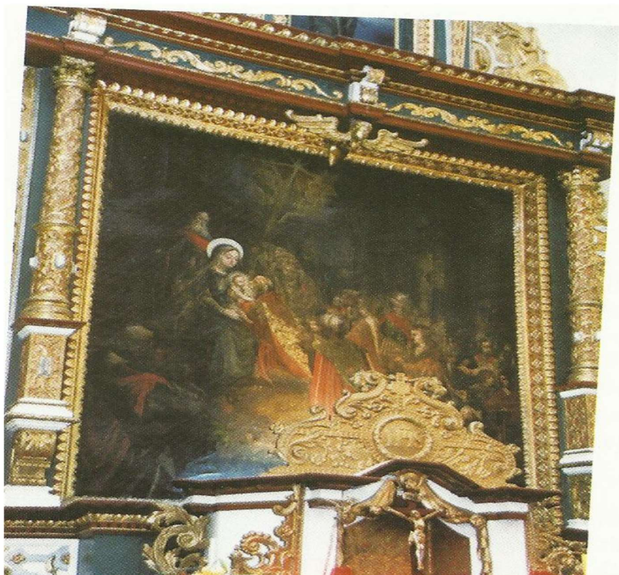
Cudowny Obraz Pokłon Trzech Króli