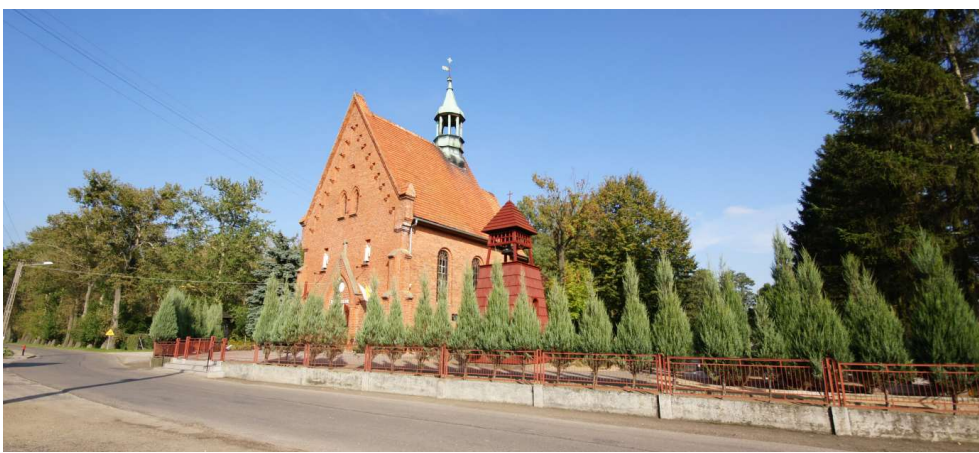
Kościół pod wezwaniem św. Katarzyny