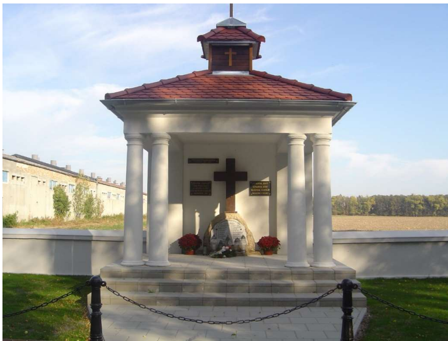
Kaplica przy wjeździe do parku od strony wschodniej