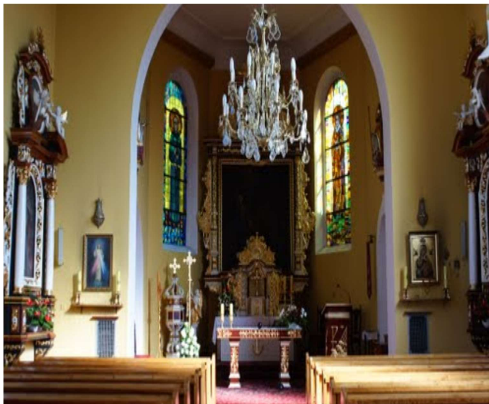
Prezbiterium w kościele pw. św. Katarzyny