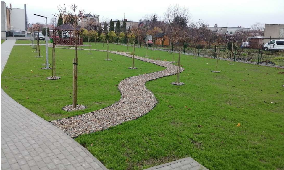
Plac rekreacyjny przy ul. Promienistej w Pępowie