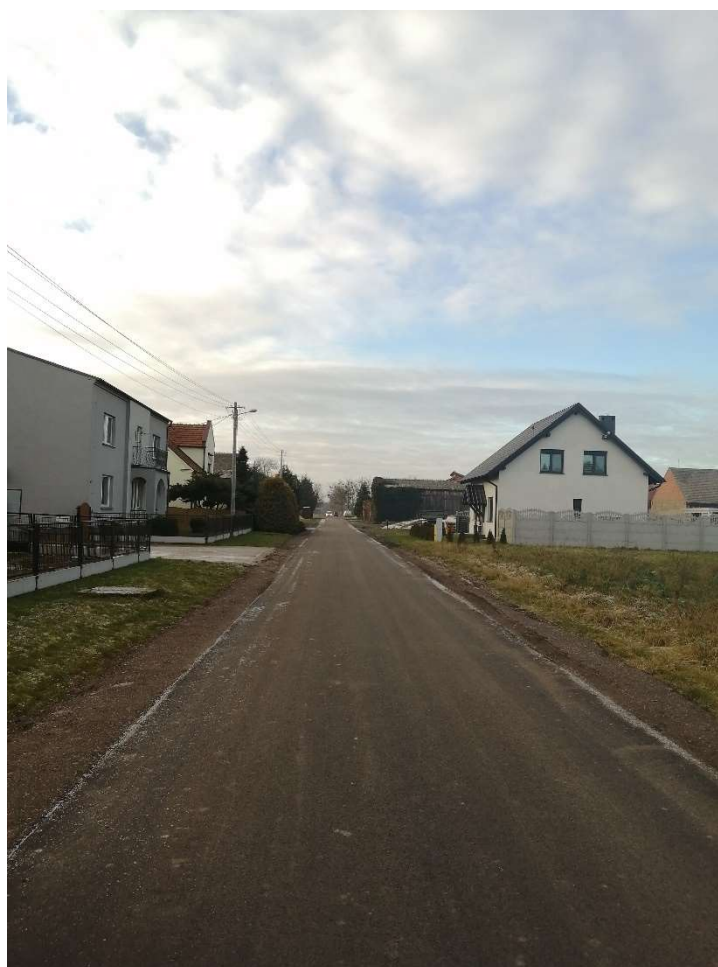
Droga „warszawska” w Babkowicach