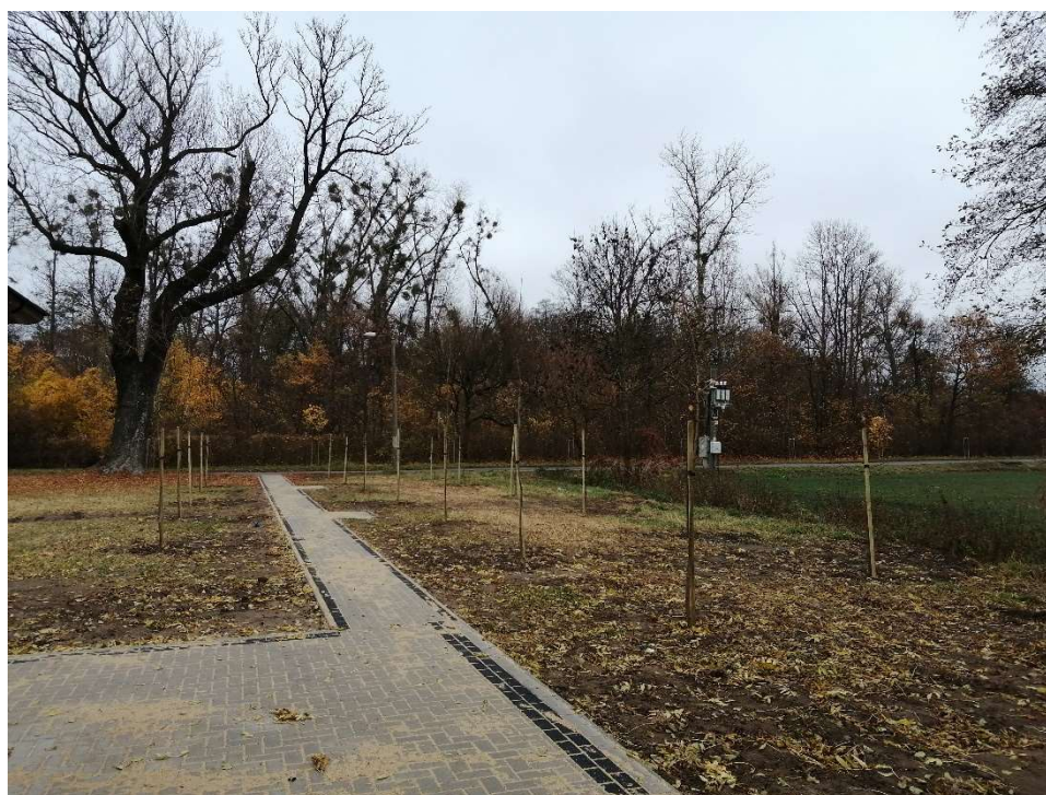
Drzewa miododajne na terenie przy świetlicy w Skoraszewicach