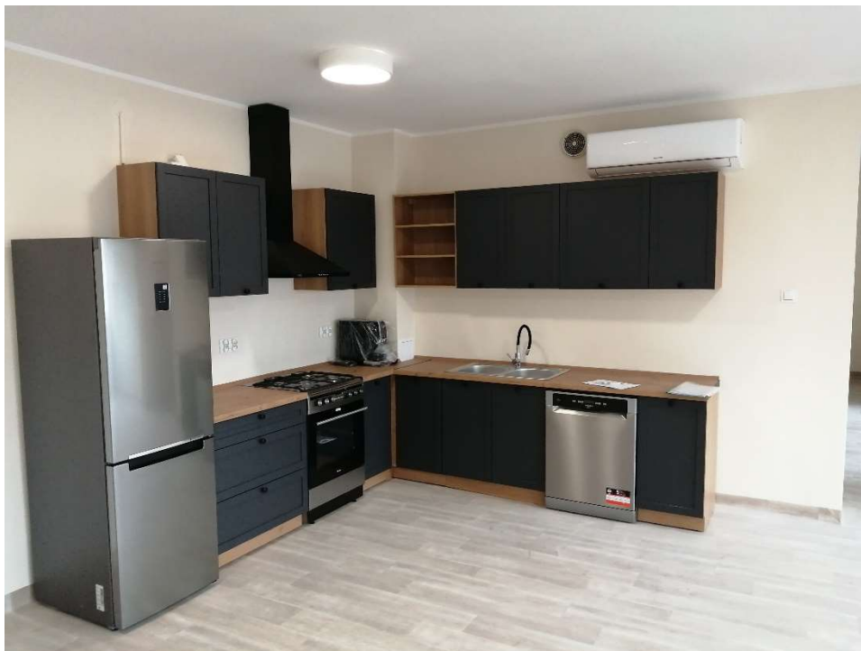
Pomieszczenie Klubu Seniora