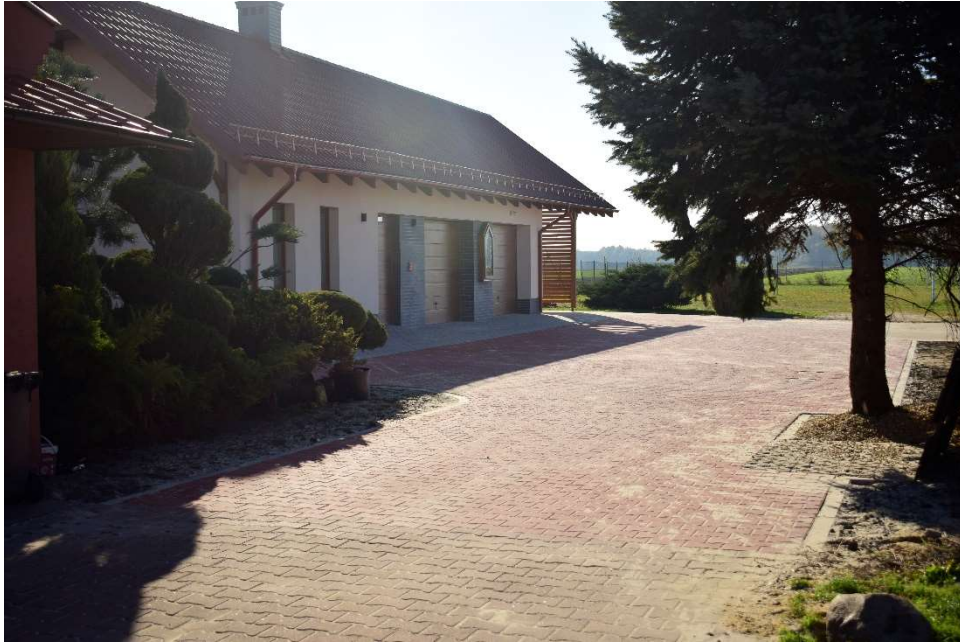
Utwardzenie przy budynku magazynowo-garażowym w Magdalenkach