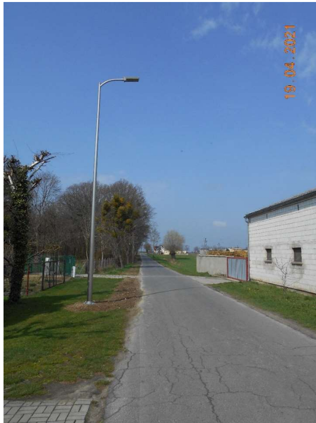
Oświetlenie uliczne w Gębicach (za parkiem)