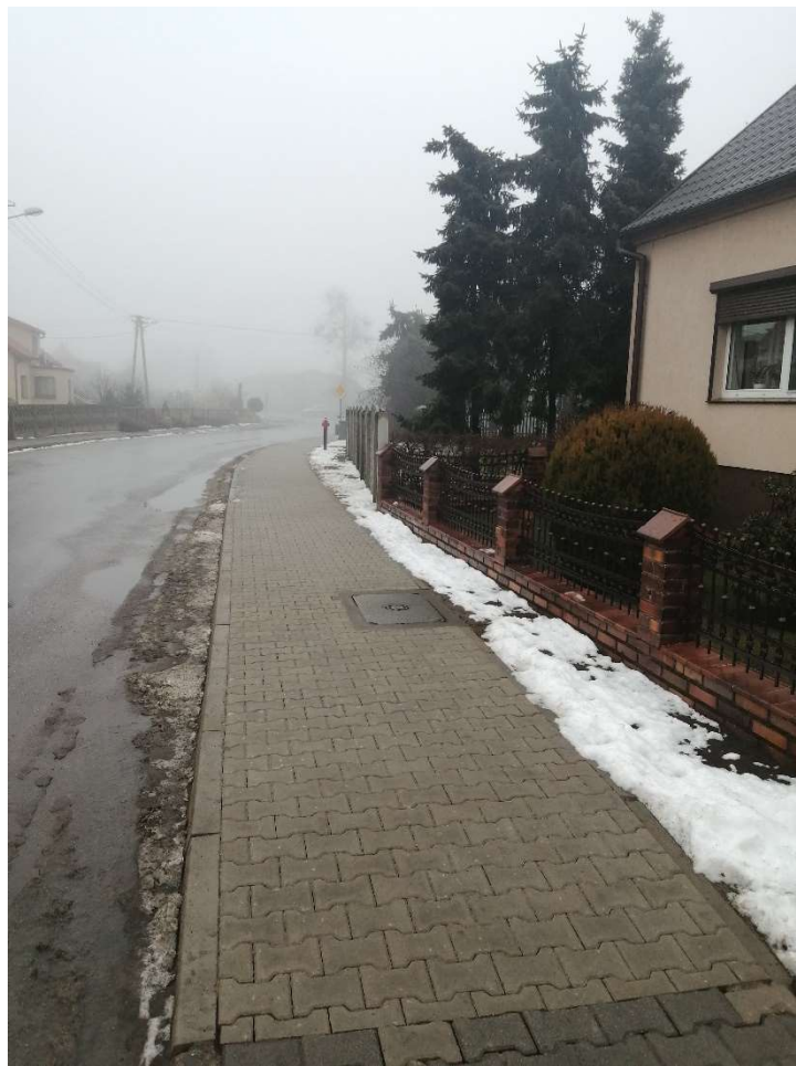
Chodnik w Skoraszewicach