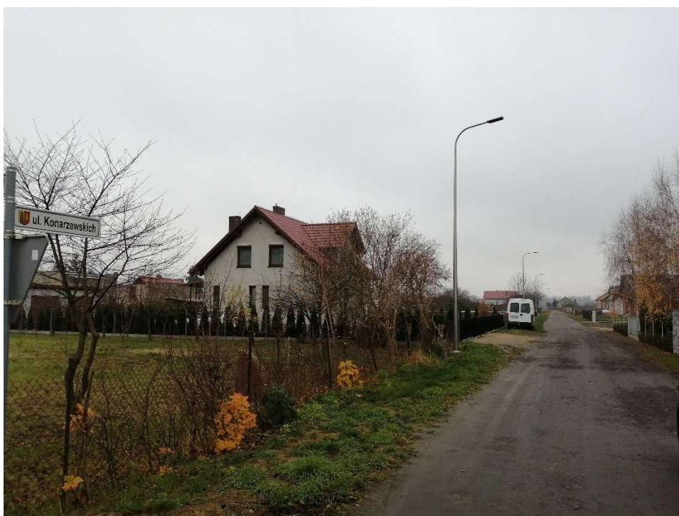
Oświetlenie uliczne przy ul. Konarzewskich w Pępowie