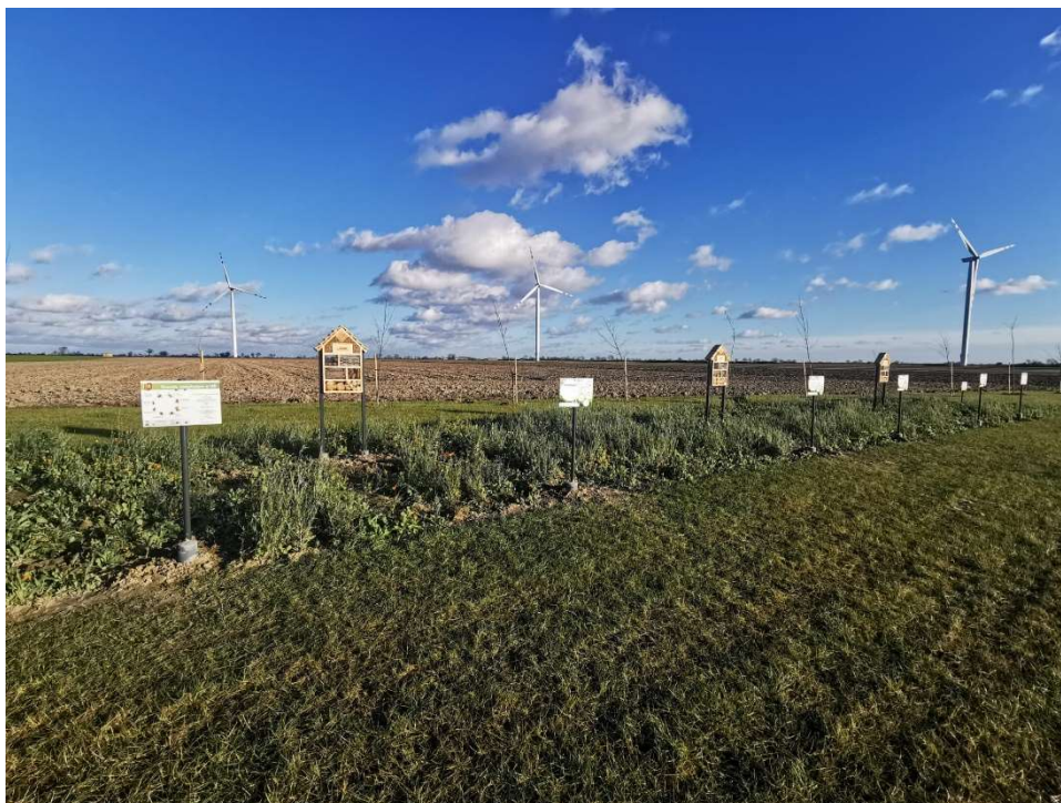
Staw Kołek w Babkowicach – łąka kwietna