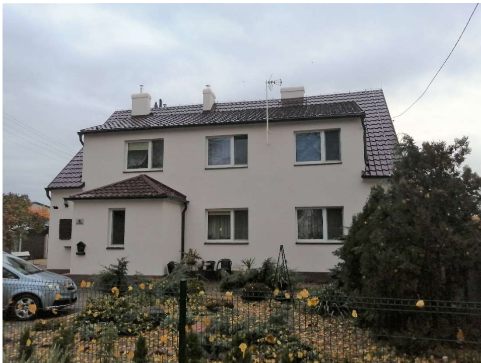
Odnowione dach i elewacja budynku komunalnego przy ul. St. Nadstawek