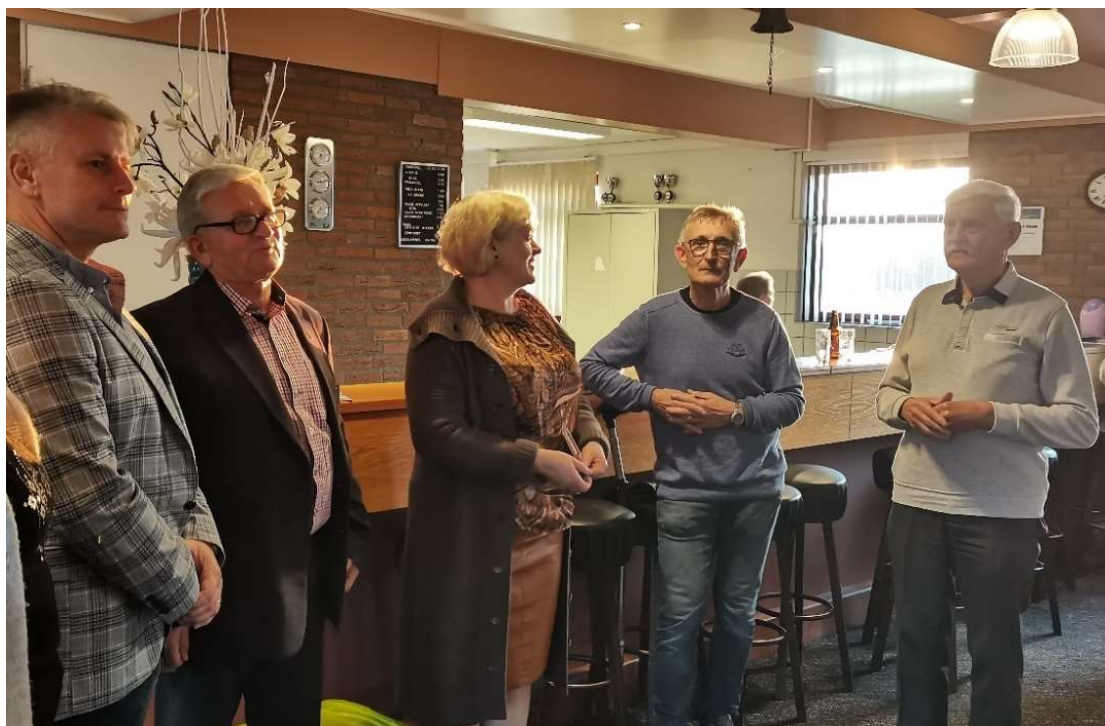
Powitanie pępowskiej delegacji w Dodewaard

W drugiej połowie października 2021 roku sześciuosobowa delegacja z gm. Pępowo gościła w partnerskiej gminie Neder-Betuwe po niemal dwuletniej przerwie spowodowanej pandemią COVID-19. Celem tej wizyty było zapoznanie się z ofertą opieki senioralnej w gminie Neder-Betuwe w ramach przygotowań do uruchomienia Klubu „Senior+” w Pępowie, podjęcie dyskusji na temat kierunków przyszłej współpracy oraz odbiór sprzętu rehabilitacyjnego i artykułów higienicznych gromadzonych przez członków holenderskiego Komitetu Neder-Betuwe – Pępowo.