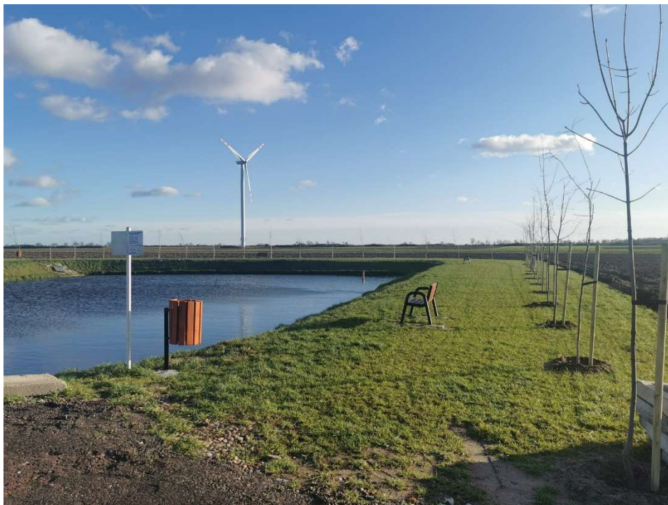
Staw Kołek w Babkovicach