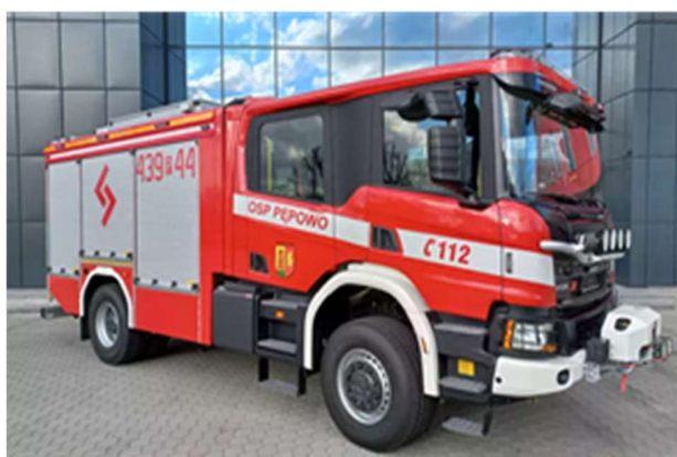
Nowy ciężki samochód ratowniczo-gaśniczy SCANIA P370 XT