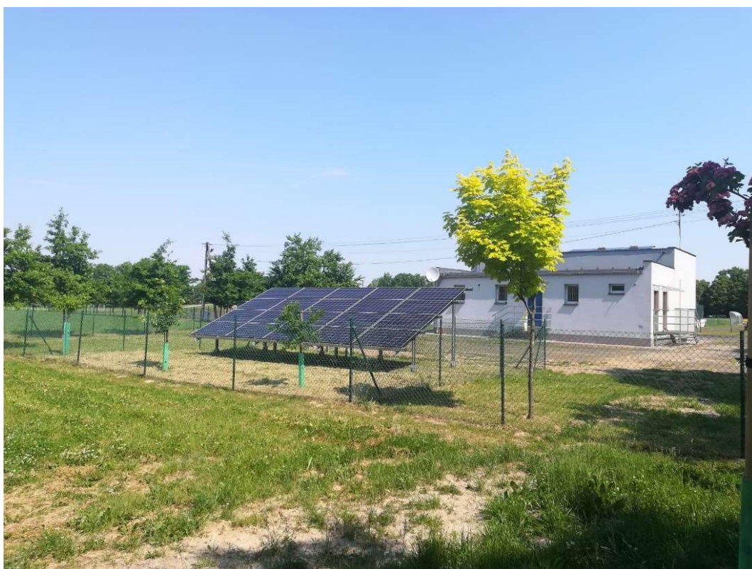
OZE przy stadionie w Pępowie