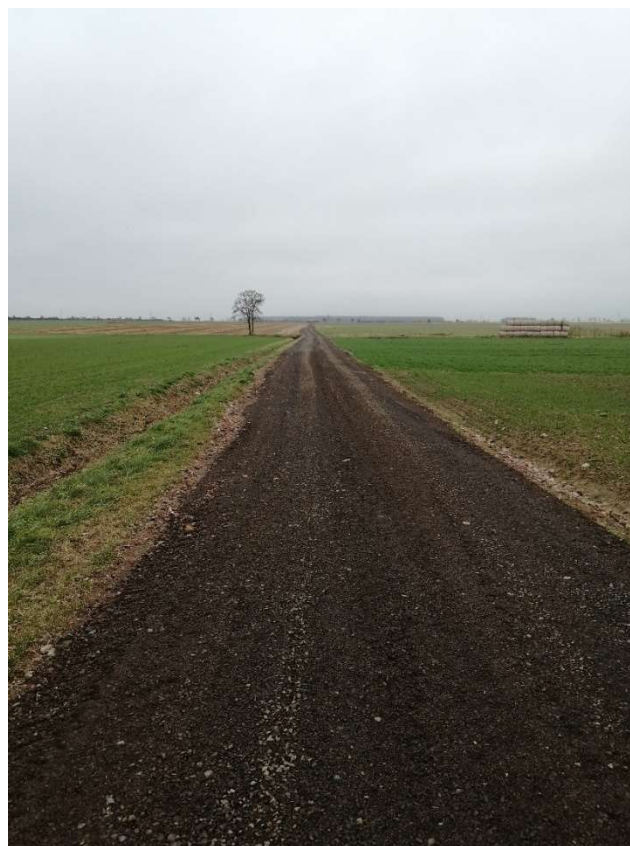
Fot. 3. Droga dojazdowa do pól w Krzyżankach