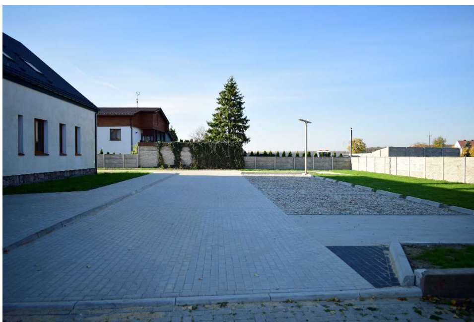
Utwardzenie przy dawnej szkole w Siedlcu