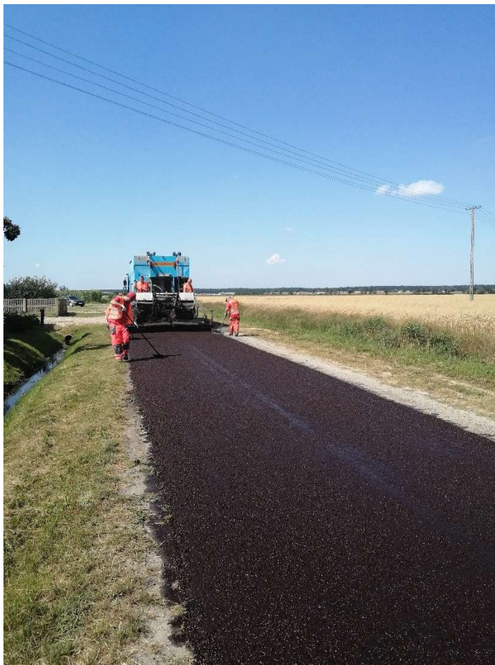
Układanie nawierzchni metodą slurry seal w Siedlcu - Elęcinie