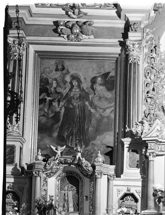
"Wniebowzięcie Najświętszej Maryi Panny" Bartłomiej Strobel

Na szczególną uwagę zasługuje znajdujący się w głównym ołtarzu obraz pędzla Bartłomieja Strobla z 1641 roku, zatytułowany "Wniebowzięcie Najświętszej Maryi Panny". Należy on do cenniejszych zabytków malarstwa z pierwszej połowy XVII wieku. Do dnia dzisiejszego trwają spory wśród znawców malarstwa, dotyczące aktualizacji tematyki religijnej przez wprowadzenie do omawianej kompozycji malarskiej osób współczesnych Stroblowi. Niektórzy badacze twierdzą że postać Pana Jezusa ma twarz króla Władysława IV Wazy, Matka Boska twarz królowej Cecylii, aniołowie oblicza kasztelanek, a namalowani u dołu obrazu apostołowie - twarze współczesnych malarzowi senatorów.