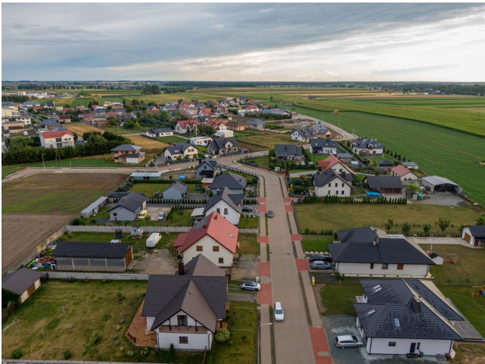
Fot. 4. Budowa ulicy Wiejskiej, Rolniczej, Ogrodowej, Żniwnej, Kwiatowej i Konarzewskich w m. Pępowo wraz z infrastrukturą – etap I