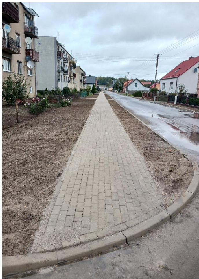
Fot. 7. Chodnik w Skoraszewicach