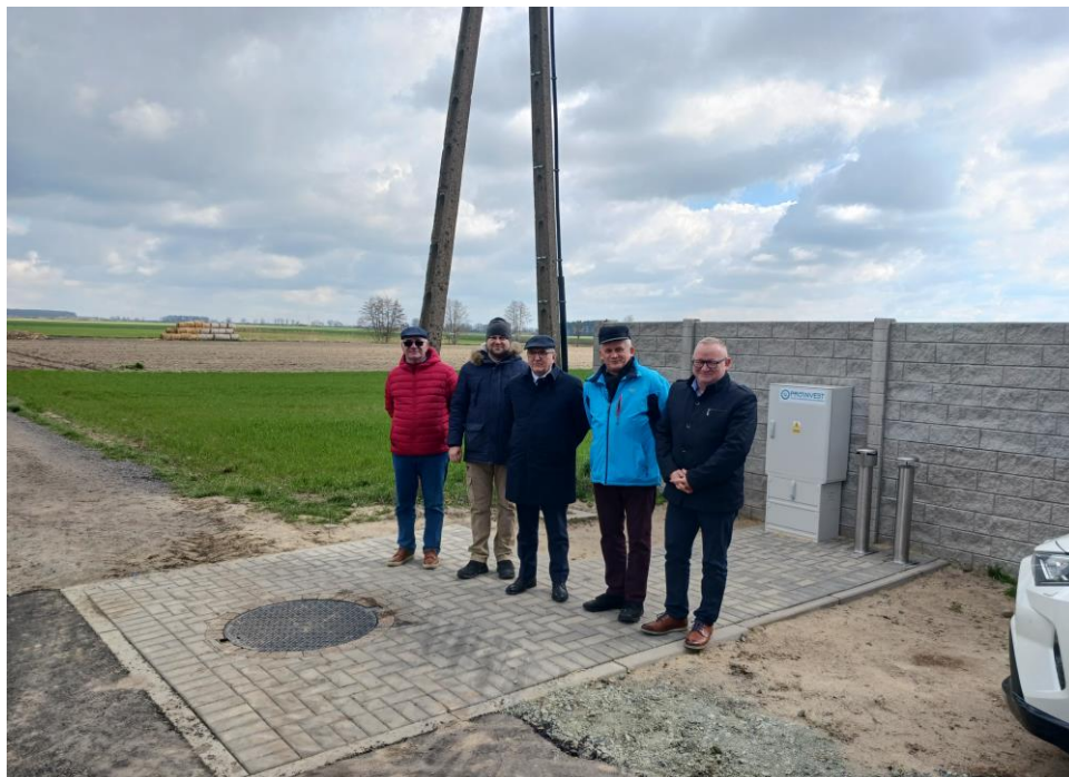
Fot. 1. Przepompownia ścieków w Krzyżankach - etap II B zadania