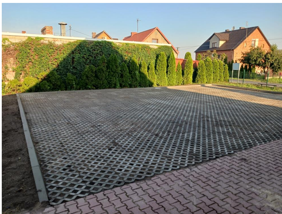
Fot. 8. Parking przy świetlicy wiejskiej w Magdalenkach