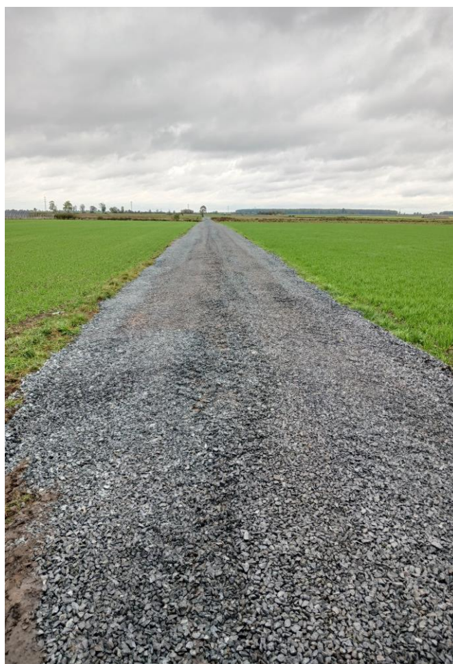
Fot. 12. Droga gminna w Krzyżankach