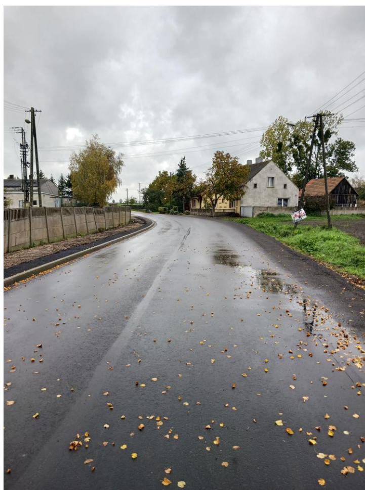
Fot. 9 i 10. Droga powiatowa w Czeluścinie