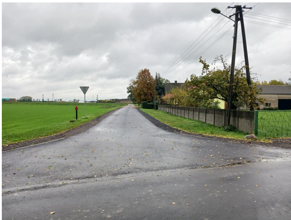
Fot. 11. Droga gminna w Czeluścinie