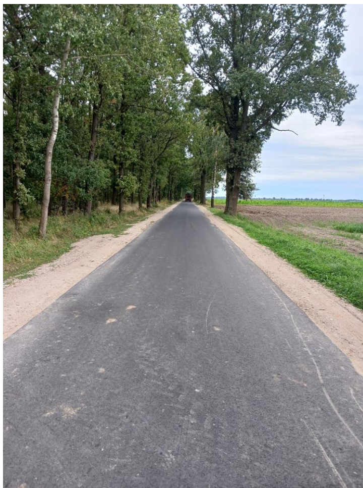
Fot. 13. Droga gminna w Babkowicach – Czerwona Róża