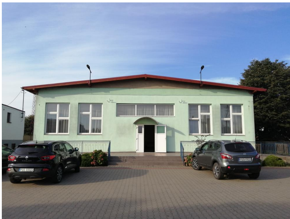
Fot. 14. Przebudowa dachu świetlicy wiejskiej w Siedlcu