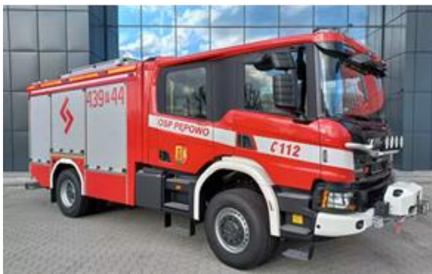
Ciężki samochód ratowniczo-gaśniczy SCANIA P370 XT (OSP Pępowo)

Jednostki OSP na swym wyposażeniu posiadają także: