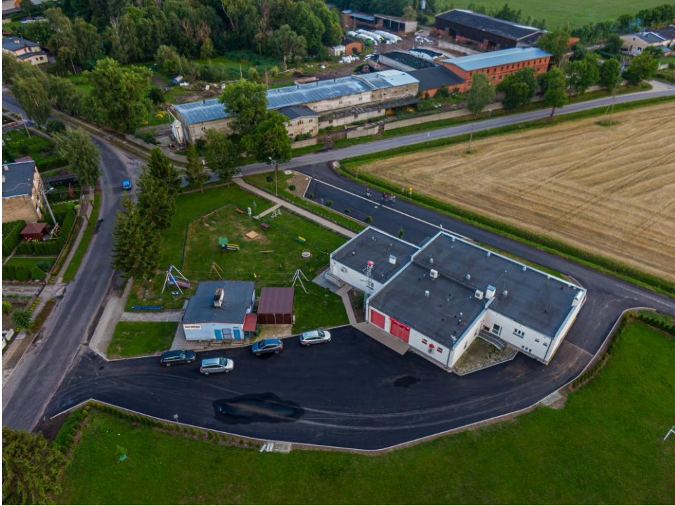
Fot. 2 i 3. Kanalizacja sanitarna wraz z odtworzoną nawierzchnią asfaltową w Babkowicach