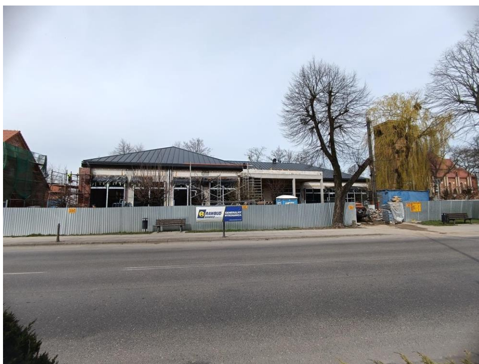
Fot. 5 i 6. Rewitalizacja centrum Pępowa wraz z budową biblioteki publicznej, infrastrukturą towarzyszącą oraz z odrestaurowaniem budynku „Szpitalik”